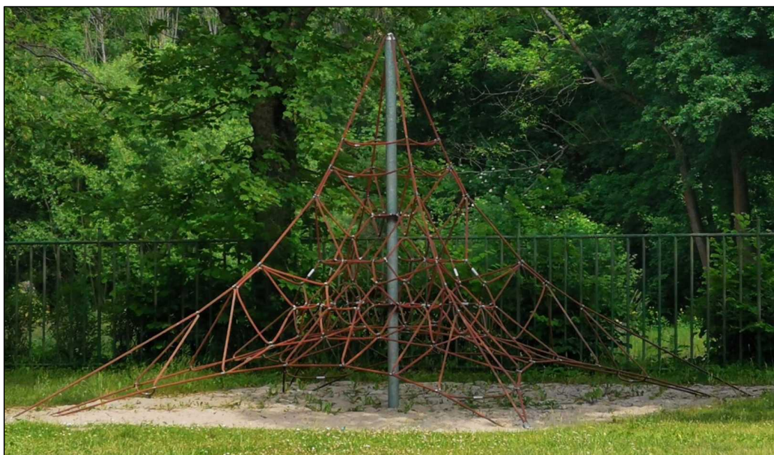
Stávající lanová pyramida