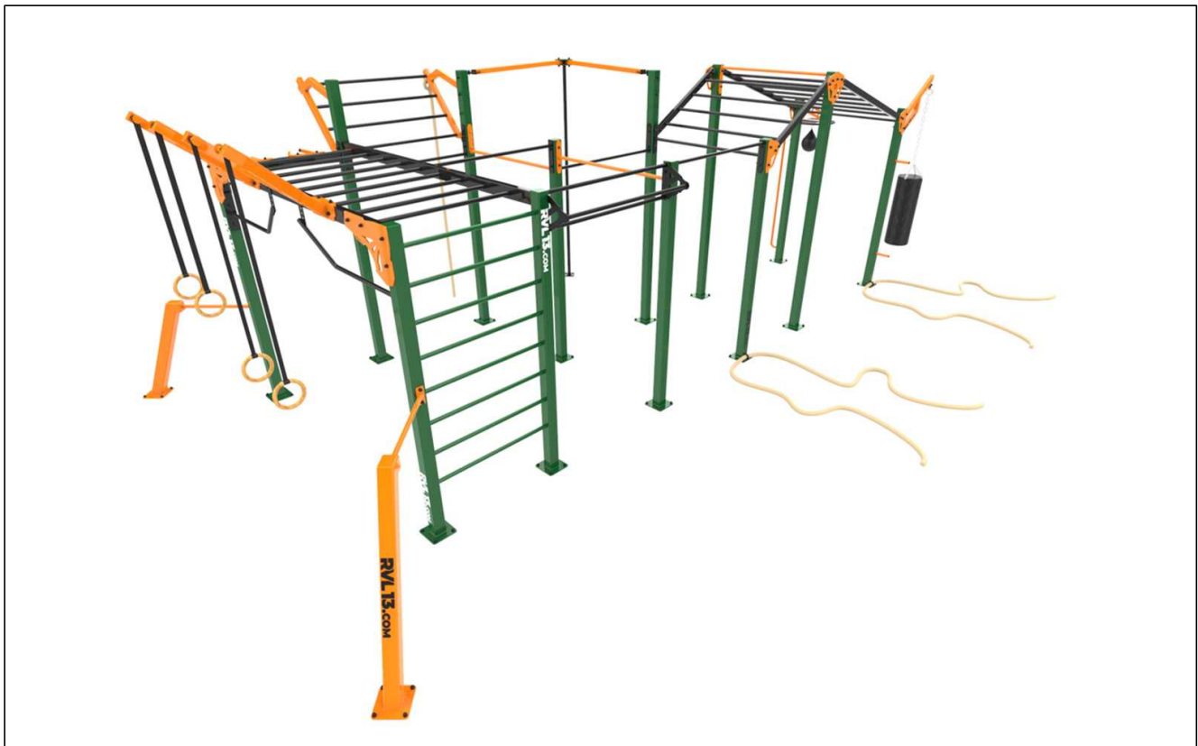
Workout - ilustrační foto