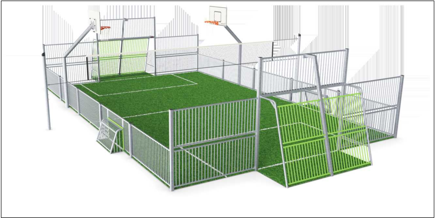
Multifunkční sportaréna - ilustrační foto návrh počítá se záchytným hrazením výšky 3,0 metru